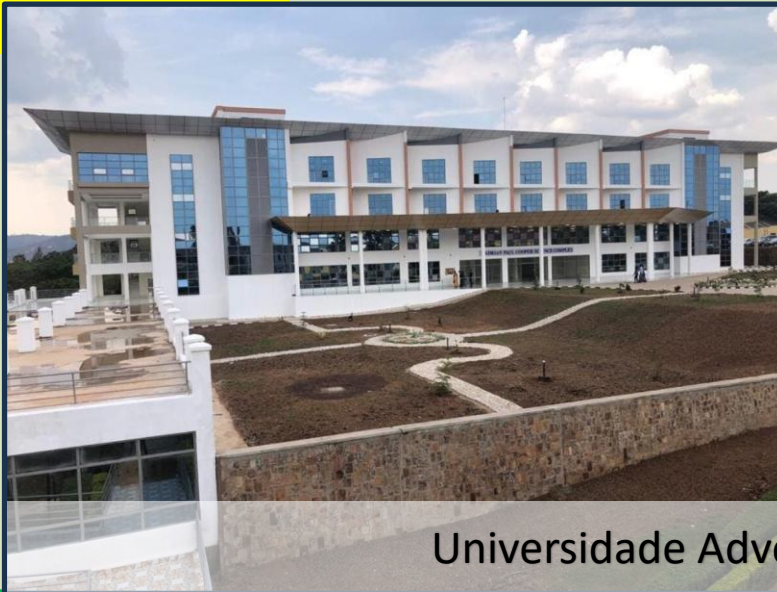
Universidade Adventista em Ruanda