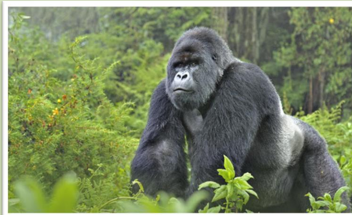
Gorila macho adulto