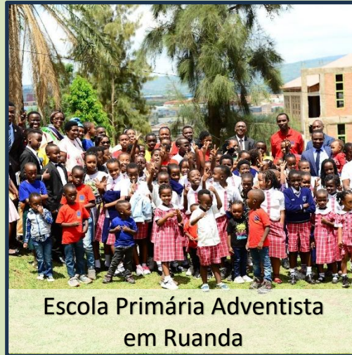
Escola Primária Adventista em Ruanda