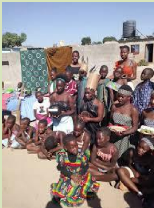
Mulheres do Sudão do Sul

No Sudão do Sul, muitas meninas não têm a oportunidade de ir à escola e muitas mulheres nunca aprenderam a ler. A Igreja Adventista no Sudão do Sul está trabalhando arduamente para ensinar mulheres e meninas a ler para que possam ler a Bíblia por si mesmas e conhecer Jesus como seu Salvador.