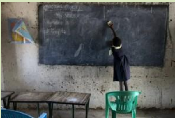
Escola no Sudão do Sul