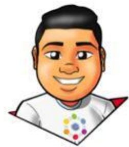
DESIGN: Gustavo Santana