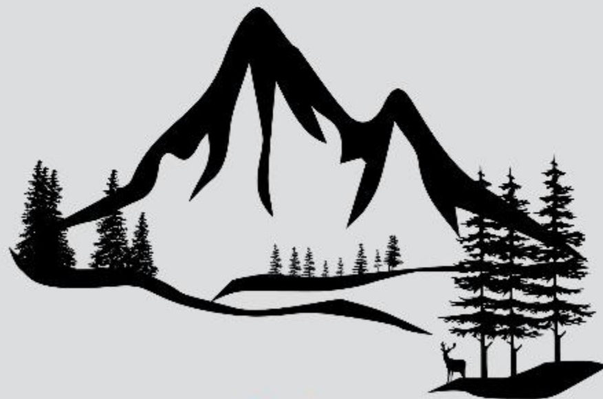
Ébal (Js 8:33)