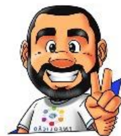
Ilustração de capa: Adinan Batista