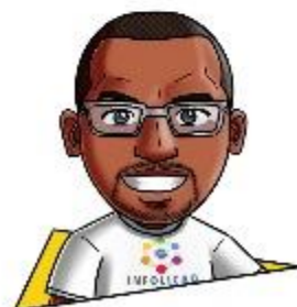
Texto e Design: Manoel Roberto