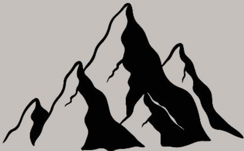
Gerizim (Dt 11:29)