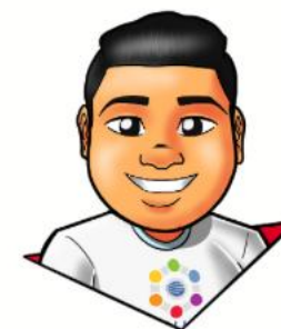
Design: Gusttavo Santana