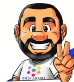
Ilustração de capa: Adinan Batista