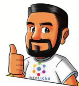
Design: Elton Batista