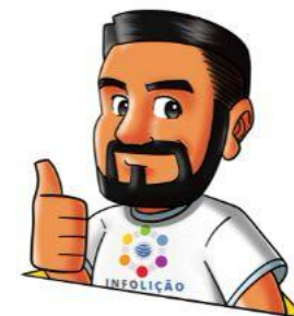
Texto e design: Elton Batista