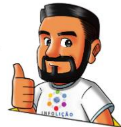
Design: Elton Batista