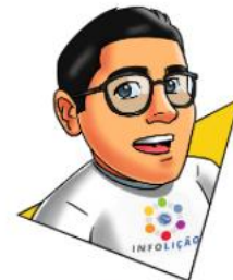
Design: Bruno Flávio