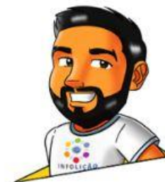
Design: Esron Wasley