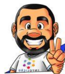
Ilustração de capa: Adinan Batista