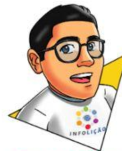
Texto e Design: Bruno Flávio