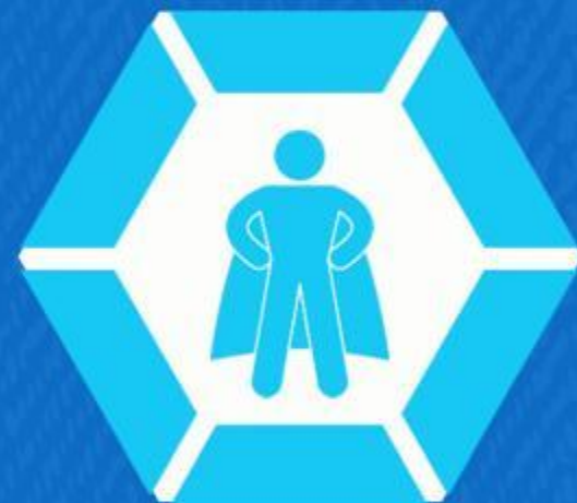
Salvador (Jo 3:36)

João Batista destaca que a verdadeira alegria no ministério não está em ser grande ou famoso, mas em cumprir a missão de exaltar Jesus (João 3:29-30).