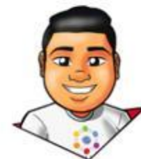
Design: Gustavo Santana