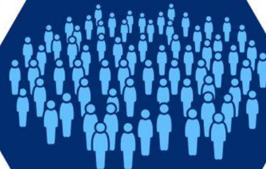
Multidão (Jo 12:13)

A visão equivocada do papel do Messias os impediu de desfrutar da presença Dele. É preciso que busquemos conhecê-Lo, para que as falsas imagens de Jesus não nos enganem (Mt 24:24).