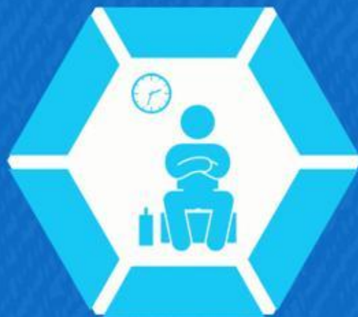
Esperado (Jo 3:29)