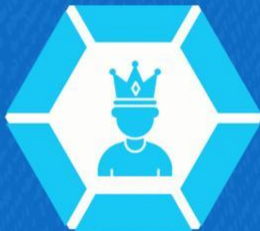
Soberano (Jo 3:35)