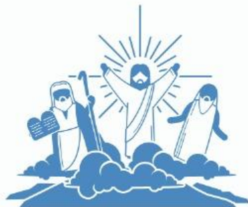
Transfiguração (Mt 17:5)