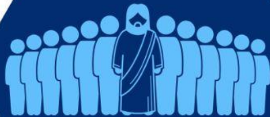
Discípulos (At 1:6)

Ao chamar Jesus de Cordeiro de Deus (Jo 1:29), João Batista rompe com a visão comum de que o Messias seria um libertador político. Vemos essa visão equivocada nos(a):