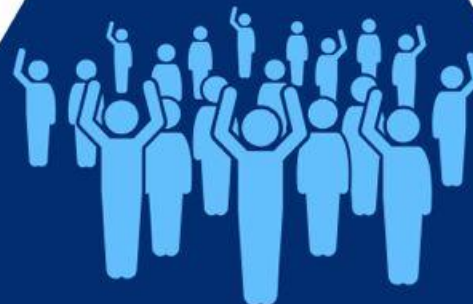
Fariseus (Mt 22:42)