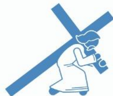
Crucificação (Jo 12:27,28)

Para muitos, nem o testemunho do Pai foi suficiente; estes não creram e, ao não crerem, negaram Aquele que testemunhou (Jo 3:32,33)."