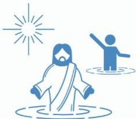
Batismo (Mc 1:11)

O maior testemunho acerca de Jesus, foi dado pelo próprio Pai. Vemos isso no (a):