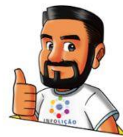
Design: Elton Batista