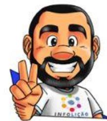
Ilustração da capa: Adinan Batista