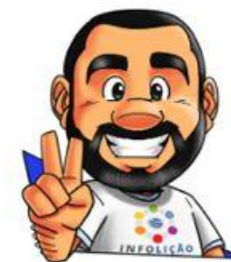
Ilustração de capa: Adinan Batista