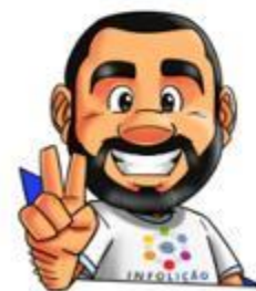
Ilustração de capa: Adinan Batista