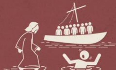
Na transfiguração (Lc 9:28, 29)