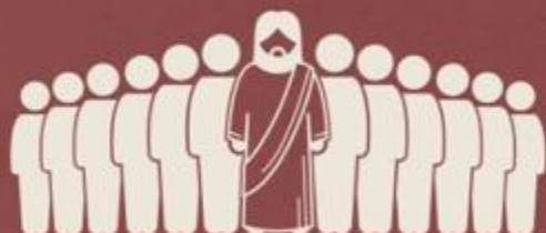
Na escolha do doze (Lc 6:12, 13)