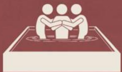
No batismo (Lc 3:21, 22)