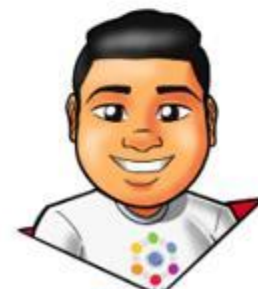
Design: Gusttavo Santana