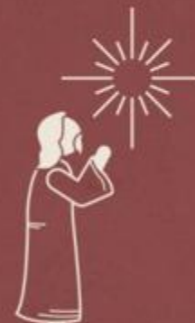
No Getsêmani (Mt 26:36-39)