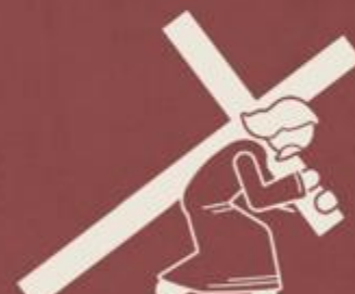
Na cruz (Lc 23:46)

As últimas palavras de Jesus antes da morte foram expressadas em oração: “Pai, nas tuas mãos entrego o meu espírito” (Lc 23:46)