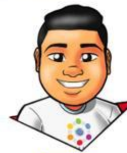
Design: Gusttavo Santana