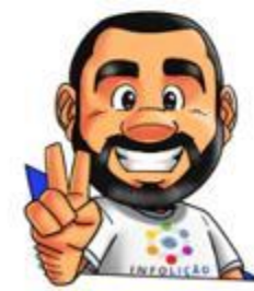
Ilustração: Adinan Batista