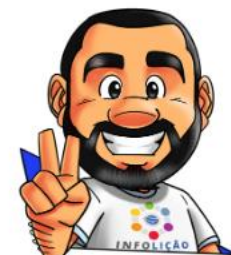
Ilustração: Adinan Batista