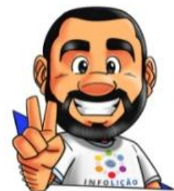
Ilustração: Adinan Batista