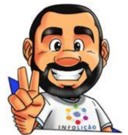
Ilustração: Adinan Batista