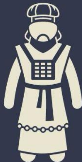
SACERDÓCIO MESSIÂNICO (Sl 110:4)