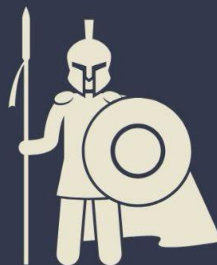
VITÓRIA MESSIÂNICA (Sl 110:5,6)

Podemos chegar-nos “confiadamente, junto ao trono da graça, a fim de recebermos misericórdia e acharmos graça para socorro em ocasião oportuna” (Hb 4:14-16).