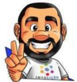
Ilustração: Adinan Batista