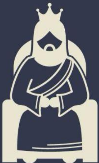
REINADO MESSIÂNICO (Sl 110:1-3)

Através do Salmo 110, somos transportados para além dos limites do tempo e espaço, para contemplar o coração da promessa divina e seu cumprimento em Jesus.