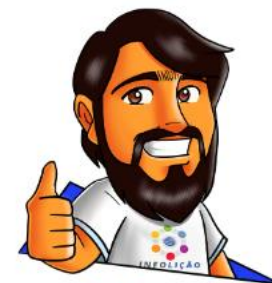
Design: Pablo Amon