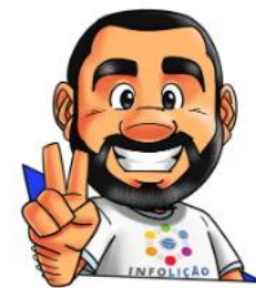
Ilustração: Adinan Batista