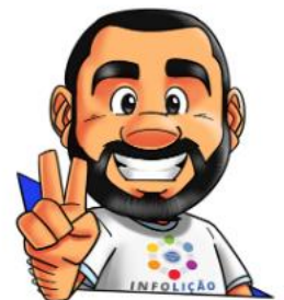
Ilustração: Adinan Batista