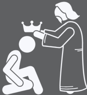
Generoso (Sl 103:3-6)