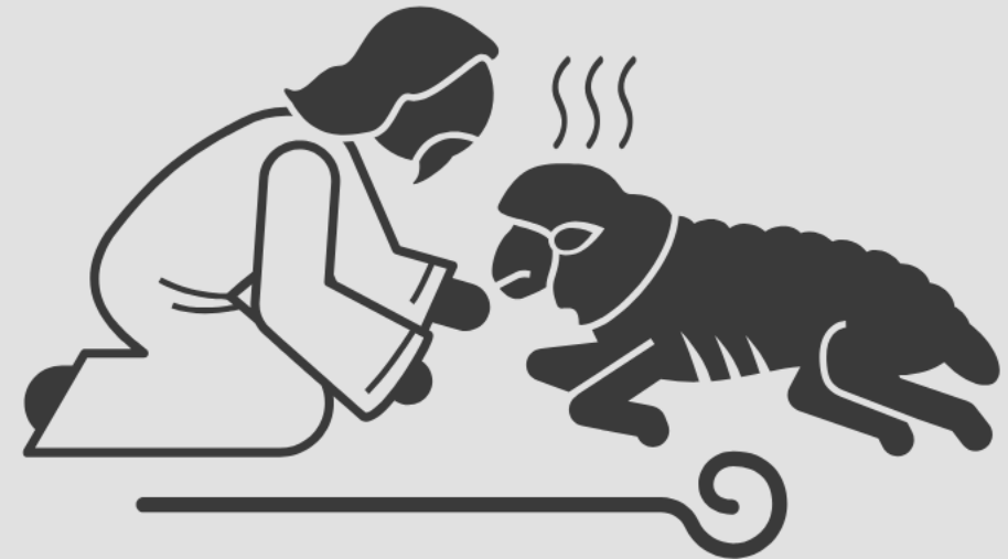
Misericórdia (Sl 113:6, 7; 123:3, 4)

A grandeza e o cuidado divinos, que não podem ser plenamente discernidos na incrível transcendência de Deus, ficam explícitos nas obras de misericórdia e compaixão divinas.