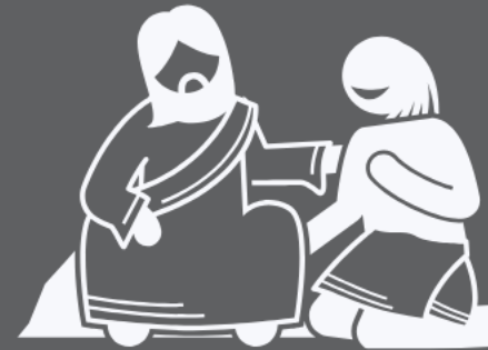
Compassivo (Sl 103:8-16)