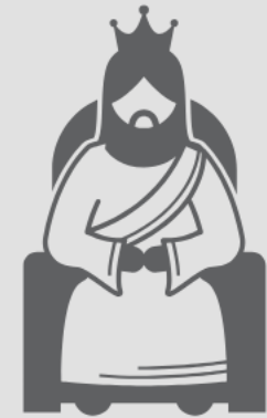
Soberano (Sl 103:19-22)

Assim como o Senhor Se lembra de Suas promessas, o povo tem a obrigação de se lembrar da fidelidade de Deus e responder-Lhe com amor e obediência.