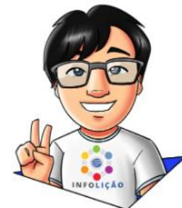
Texto e Design: Eduardo Harada