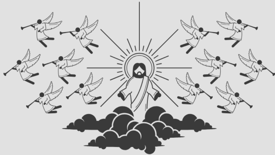
Majestade (Sl 113:4, 5; 123:1, 2)

Dois aspectos diferentes do caráter divino são descritos nos Salmos 113 e 123 :