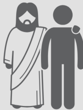
Fiel (Sl 103:7, 17, 18)