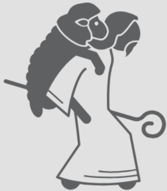
Benfeitor (Sl 103:1, 2)

O Salmo 103 enumera as múltiplas bênçãos do Senhor, retratando mais uma vez as características desse Deus misericordioso: