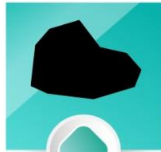
Rocha (Sl 31:2)