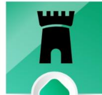
Fortaleza (Sl 31:3)