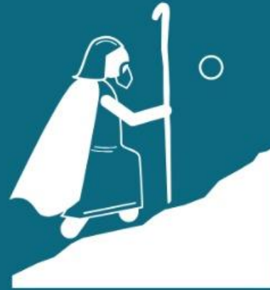
Relacionamento (Sl 114:2)