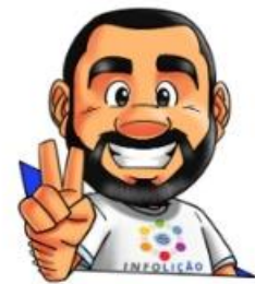
Ilustração: Adinan Batista