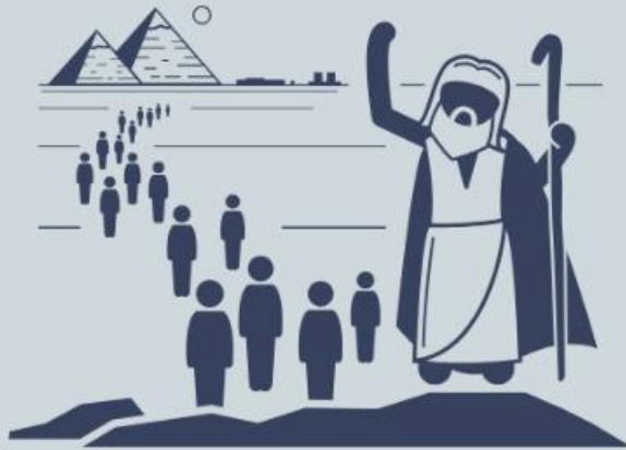
Libertação (Sl 114:1)

A fuga do Egito é um dos temas recorrentes nos Salmos (74; 77; 78; 52, 53; 106; 136). No salmo 114 são vistos de forma poética e metafórica elementos da graça divina: