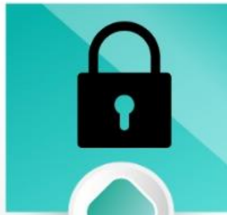
Refúgio (Sl 31:1)