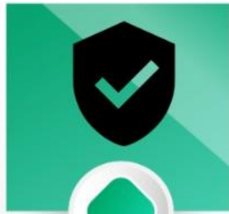
Escudo (Sl 17:9b)