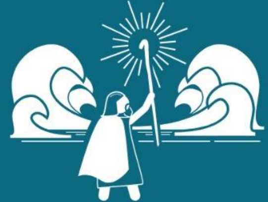
Conquista (Sl 114:3)

As grandes obras do Senhor em favor de Seu povo devem inspirar toda a Terra a tremer diante de Sua presença (Sl 114:7)