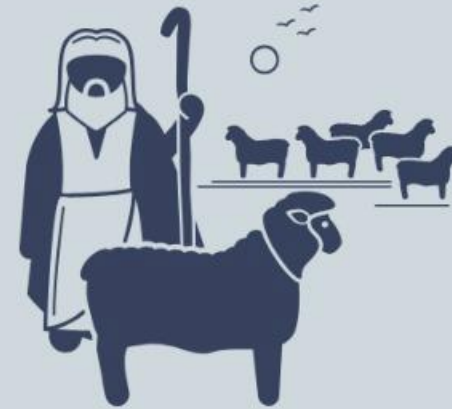
Provisão (Sl 114:8)