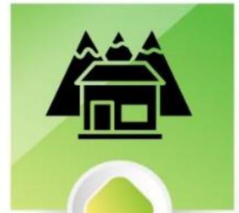
Abrigo (Sl 91:9)

O Senhor é comparado a uma águia que protege seus filhotes como as suas asas (Êx 19:4; Dt 31:11)