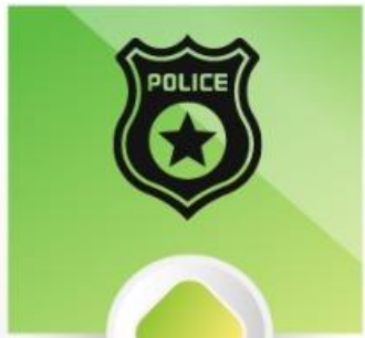
Proteção (Sl 17:9a)

Os salmistas encontraram vários sinônimos e expressões similares para afirmar e pedir segurança a Deus. Dentre elas temos: