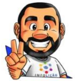
Ilustração: Adinan Batista