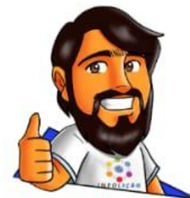
Texto e Design: Pablo Amon