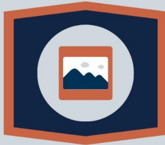
Imagens (Sl 17:8)