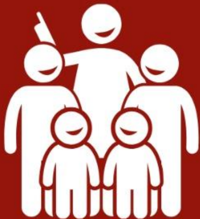
Filhos do Corá (Sl 44 a 49)