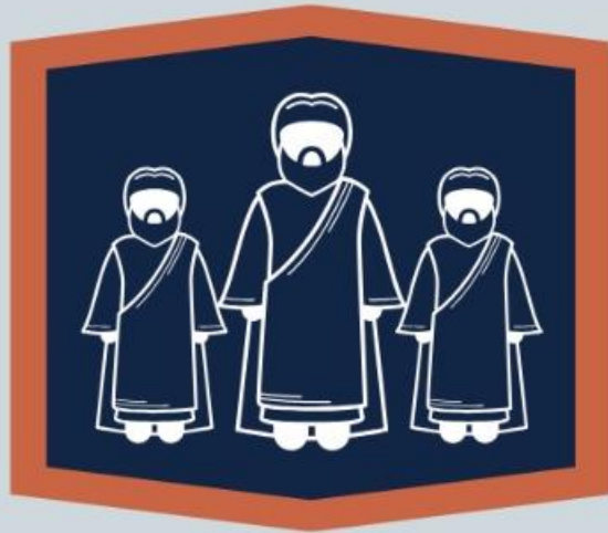
Dos coraítas (Sl 42 a 49; 84; 85; 87; 88)