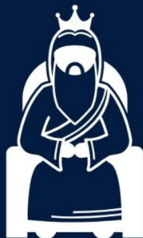
Salomão (Sl 72 e 127)