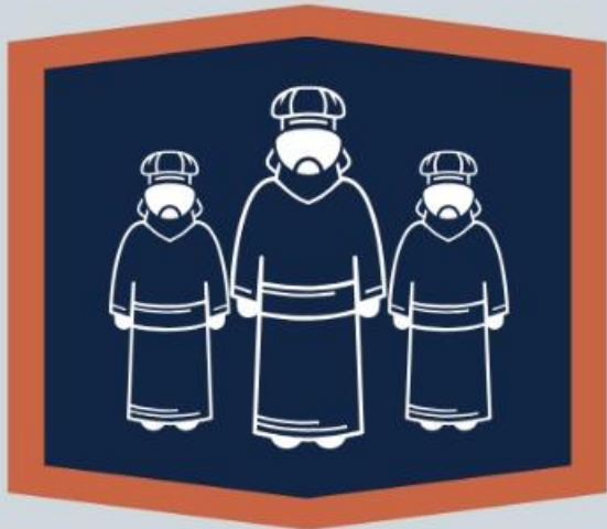
Dos asafitas (Sl 73 a 83)

Os 150 salmos podem ser divididos em 5 livros: I (1-41), II (42-72), III (73-89), IV (90-106) e V (107-150). Além dessa divisão, outras coleções registradas são: