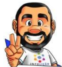
Ilustração: Adinan Batista