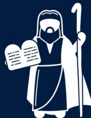
Moisés (Sl 90)

Davi não só foi o maior autor em quantidade, mas em diversidade, escrevendo salmos de louvor (68), de lamento (143), de penitência (51), imprecatórios (35), sapienciais (37), reais (24) e messiânicos (132).