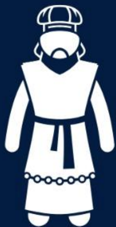
Asafe (Sl 73 a 83)

O Espírito Santo inspirou vários homens na composição dos salmos. Eis alguns exemplos: