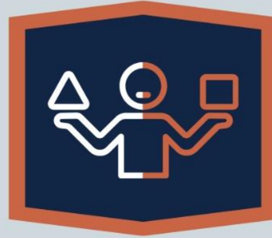
Merisma (Sl 88:1)