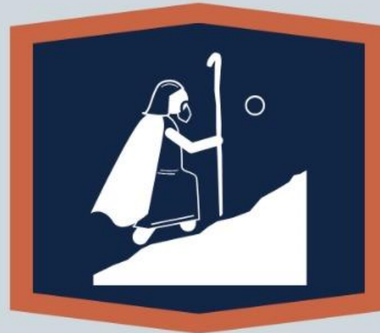
De ascensão (Sl 120 a 134)