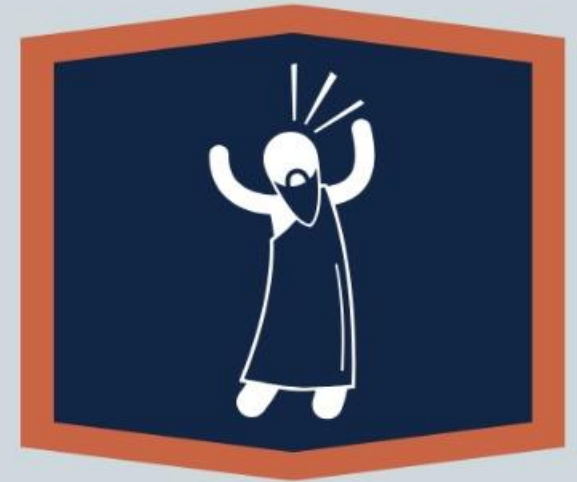
De aleluia (Sl 111 a 118; 146 a 150)