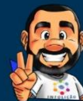
Ilustração de capa: Adinan Batista