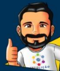
Design: Elias Duarte