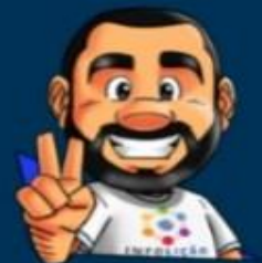
Ilustração de capa: Adinan Batista