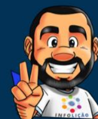
Ilustração de capa: Adinan Batista