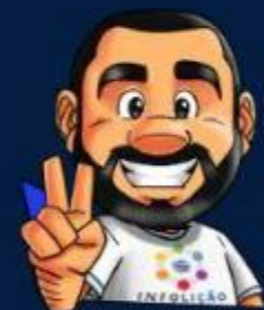
Ilustração de capa: Adinan Batista