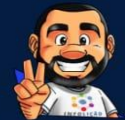
Ilustração de capa: Adinan Batista