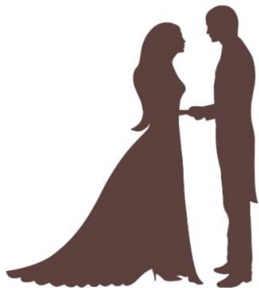
Marido-mulher (Ef 5:22-23)

Paulo apresentou o princípio da igualdade, onde todos devem permanecer no Espírito e em submissão uns aos outros em temor a Deus (Ef 5:18-21). Modificou as relações: