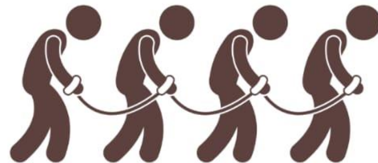
Senhor-escravo (Ef 6:5-9)

A graça recebida deve emanar em todas as nossas relações (Ef 5:15,16).