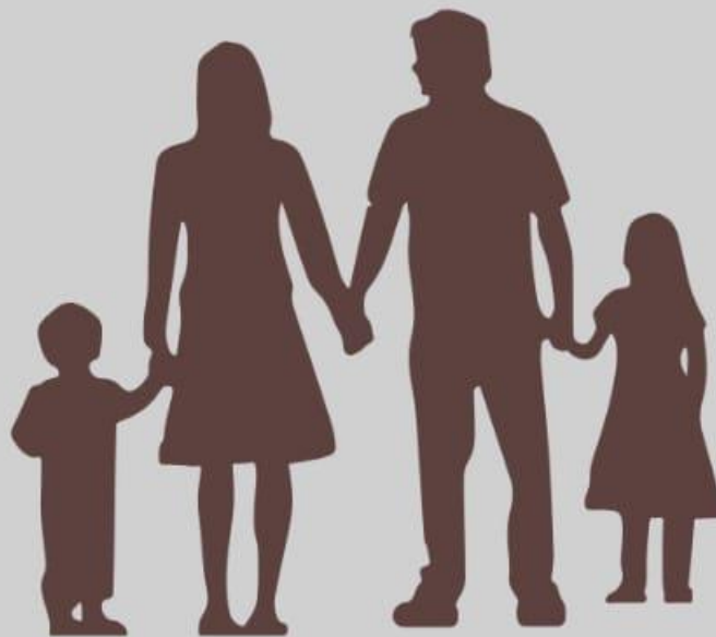
Pais-filhos (Ef 6:1-4)