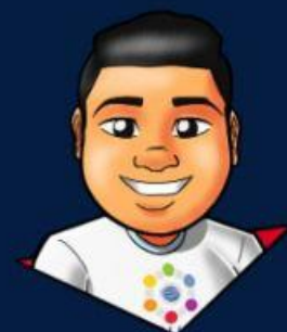
Design: Gustavo Santana