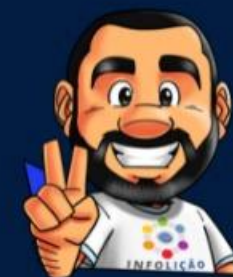
Ilustração de capa: Adinan Batista