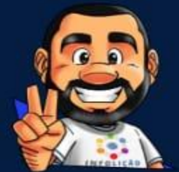
Ilustração de capa: Adinan Batista