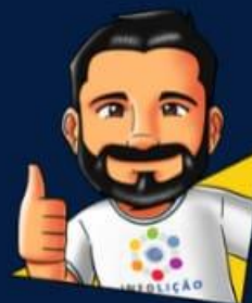
Design: Elias Duarte