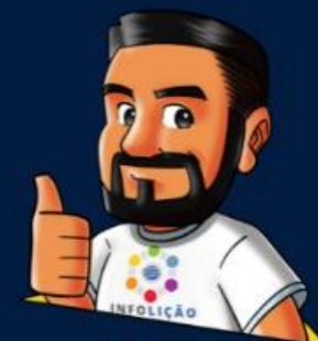
Design: Elton Batista