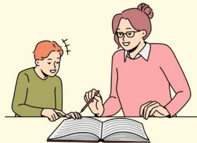
SUBMISSÃO A JESUS (Ef 1:18-21)

A paternidade espiritual paulina é marcada pela intercessão e orientação dos seus filhos na fé (1Co 4:14,15).