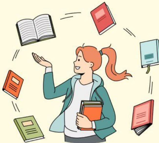
DISCERNIMENTO ESPIRITUAL (Ef 1:18-21)