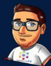
Texto Emerson Camara