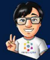
Texto & design Eduardo Harada