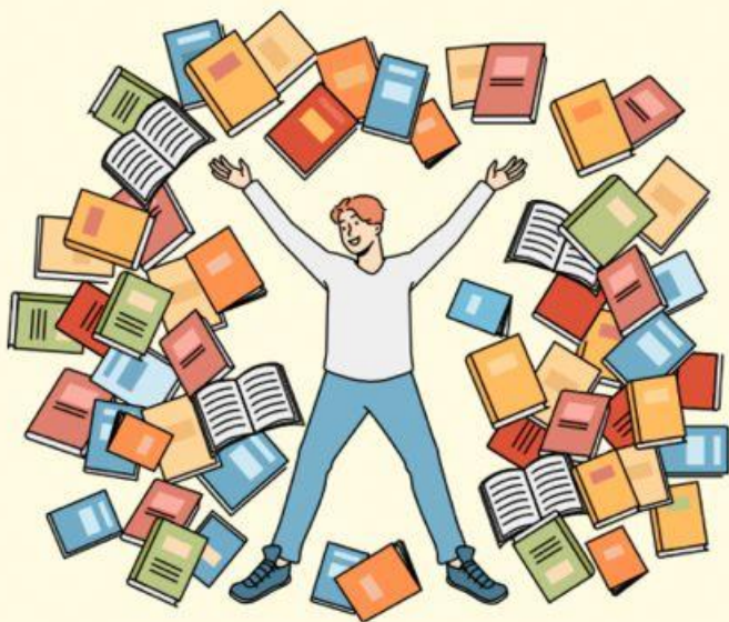
CONHECIMENTO DE DEUS (Ef 1:17)