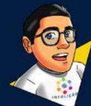
Texto & design Bruno Flávio