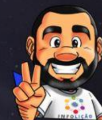
Ilustração de capa: Adinan Batista