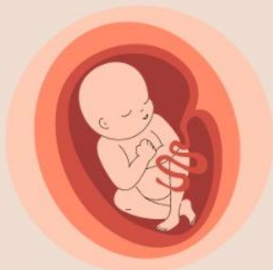
Imagem e semelhança Fomos feitos parecidos com Deus. (Gn 1:27)

Todas as pessoas tem muito valor para Deus. Todos pertencemos à mesma família e temos uma herança compartilhada: