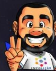
Ilustração de capa: Adinan Batista