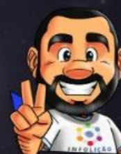
Ilustração de capa: Adinan Batista