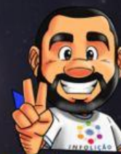
Ilustração de capa: Adinan Batista