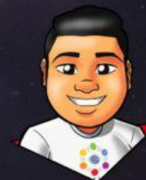
Design: Gustavo Santana