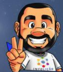
Ilustração de capa: Adinan Batista