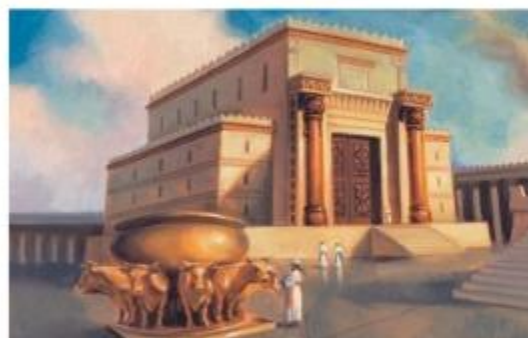
O Templo em Jerusalém. (Mt 3:10)