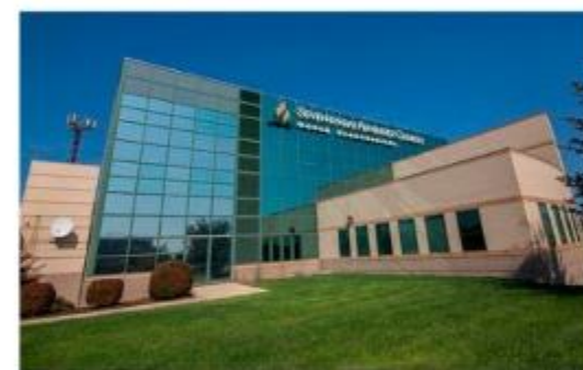
As instâncias regionais da igreja. (Dt 12:5-14)

Em harmonia com esse princípio bíblico, a Igreja Adventista do Sétimo Dia designou as Associações e Missões como casas do Tesouro, a partir das quais o ministério é mantido.