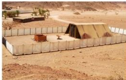
O Tabernáculo em Siló. (1Sm 1:3, 24)