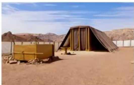
O Santuário no deserto. (Êx 36:3; Nm 18:21)