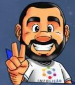
Ilustração de capa: Adinan Batista