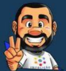
Ilustração da capa: Adinan Batista