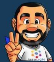
Ilustração da capa: Adinan Batista