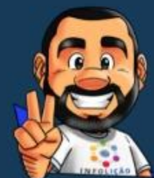
Ilustração da capa: Adinan Batista