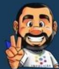
Ilustração da capa: Adinan Batista