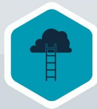
Jacó (Gn 28:14)

Esses elementos vêm acompanhados da posse e domínio total da terra (Gn 1:28).