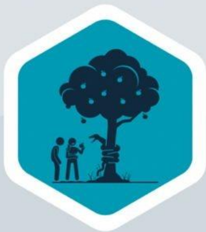
Adão (Gn 1:28)

Fecundar, multiplicar e encher a a terra eram elementos da aliança entre Deus e o homem. Podemos verificar isso nas alianças com: