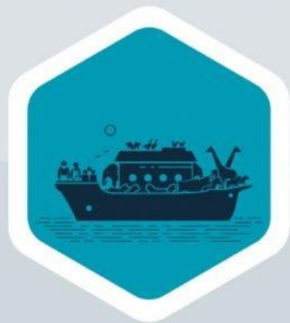
Noé (Gn 9:1, 7)