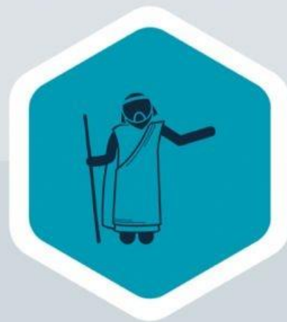
Isaque (Gn 26:4)