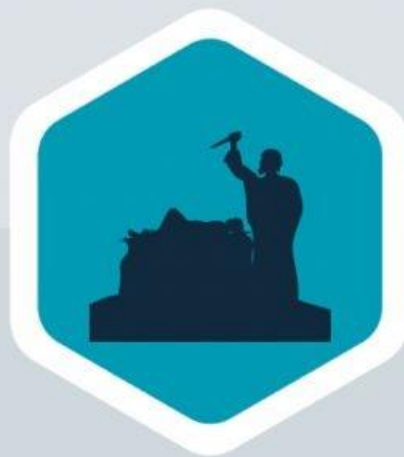
Abraão (Gn 17:6, 20)