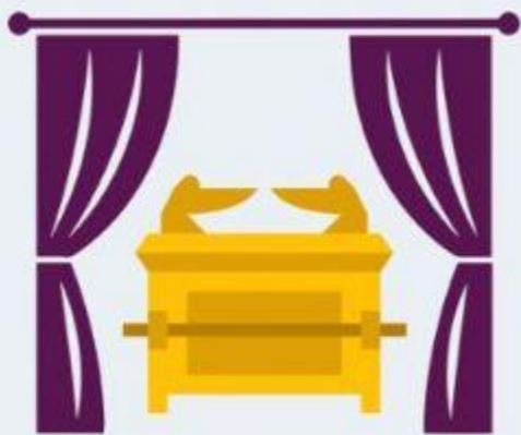
O VÉU (Êx 26:31-35; 28:43)

Deus estabeleceu limites de proteção que restringiam o acesso ao santuário. Isto impedia a intervenção de pessoas não autorizadas.