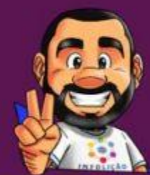
Ilustração da capa: Adinan Batista