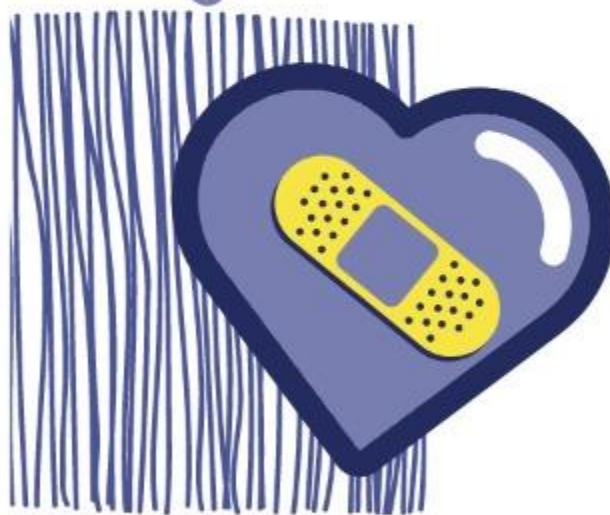
Para o coração mau (Ez 36:26)