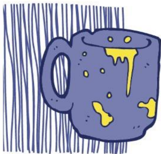
Para a imundícia (Ez 36:25)