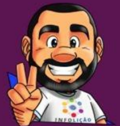
Ilustração da capa: Adinan Batista