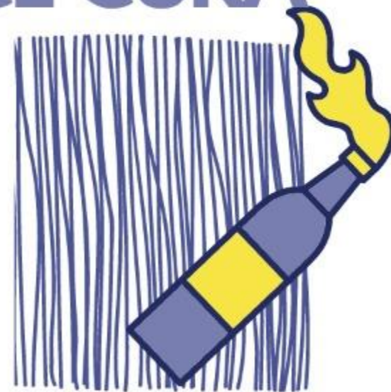
Para rebeldia (Ez 36:31)

A antiga aliança era essencial para identificar a imundícia do pecado. Contudo, ela não oferecia solução para quem já estava em pecado, apenas Cristo poderia fazê-lo (Rm 5:10)