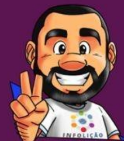
Ilustração da capa: Adinan Batista