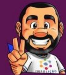
Ilustração da capa: Adinan Batista