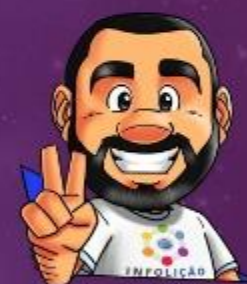
Ilustração da capa: Adinan Batista