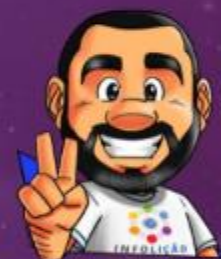
Ilustração da capa: Adinan Batista