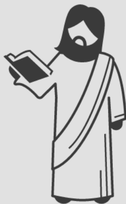
Moisés escreveu a respeito de Jesus (Jo 5:46)