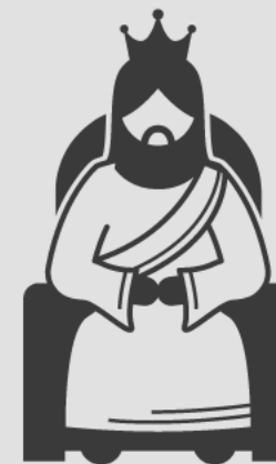
Abraão alegrou-se ao ver o dia de Jesus (Jo 8:56)

Junto com os discípulos no caminho de Emaús, o próprio Cristo "começando por Moisés, percorrendo por todos os Profetas, expunha-lhes o que a Seu respeito constava em todas as Escrituras" (Lc 24:27).