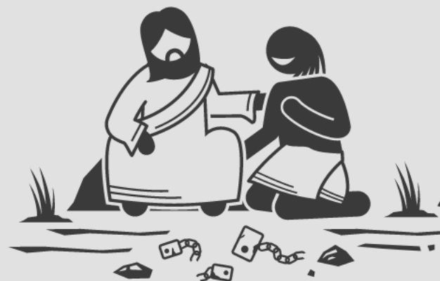
Isaiás antecipou o ministério de Jesus (Lc 4:18)