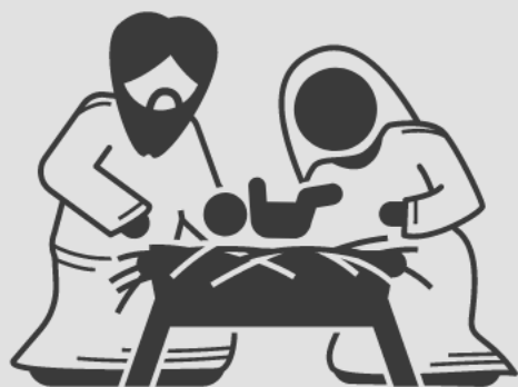
Enoque profetizou a vinda de Jesus (Jd 14, 15)

Para os escritores do Novo Testamento, a esperança cristã não era uma "novidade", mas o desdobramento das crenças dos patriarcas e profetas.