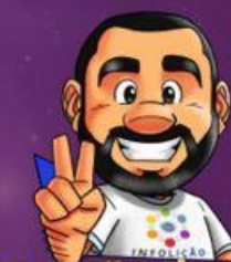
Ilustração da capa: Adinan Batista